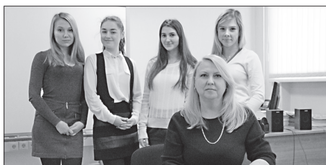
КАК СТАТЬ ПОЛИГЛОТОМ