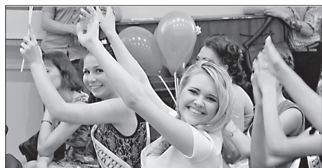
КОЛЛЕДЖ - НАШ ДОМ

■ ДМИТРИЙ БЫКОВ