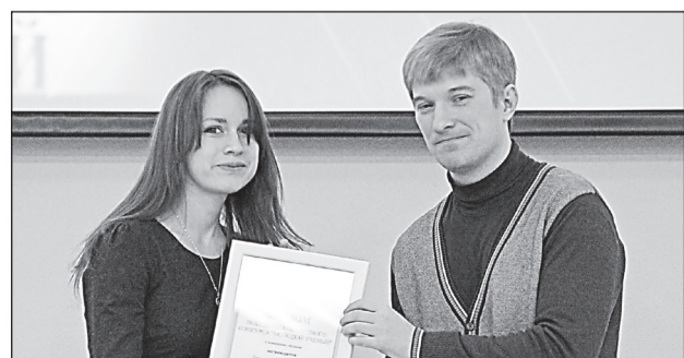
СТИМУЛ К ДАЛЬНЕЙШЕЙ РАБОТЕ