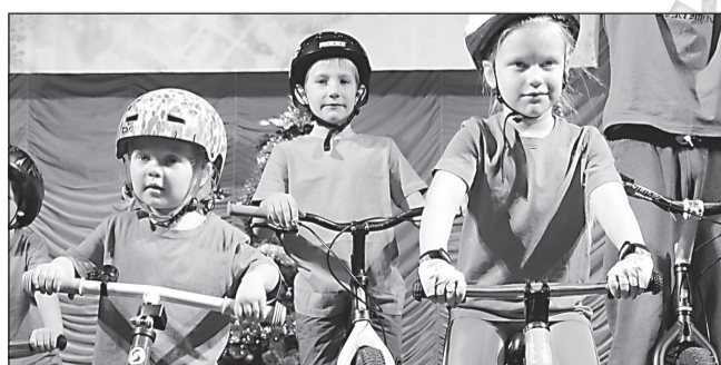
ГУБЕРНИЯ ВСЕГДА В ПЯТЁРКЕ