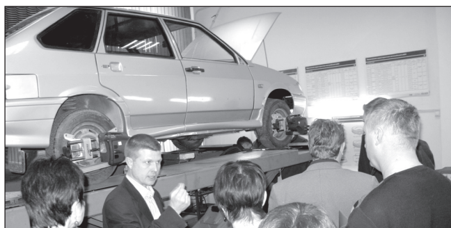
РАЗВИТИЕ СЕТЕВЫХ РЕСУРСОВ