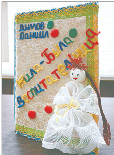
СП «Детский сад № 69» ГБОУ СОШ № 6 г.о. Сызрань

Прознали об этом малыши-крепыши и стали «голову ломать», как злых пира- тов победить, замок отстоять и не отдать