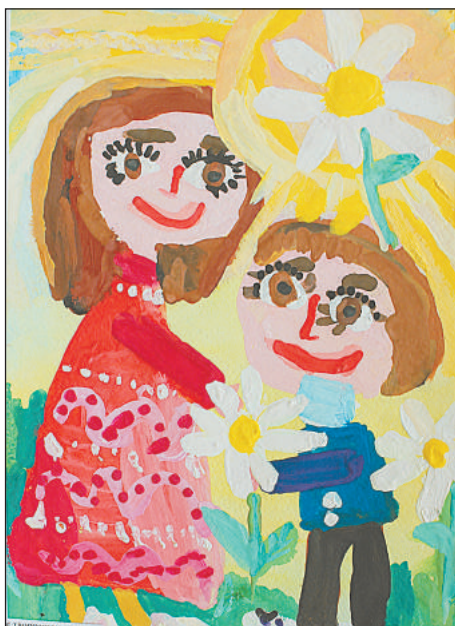
МБУ детский сад № 49 «Весёлые нотки» г.о.Тольятти