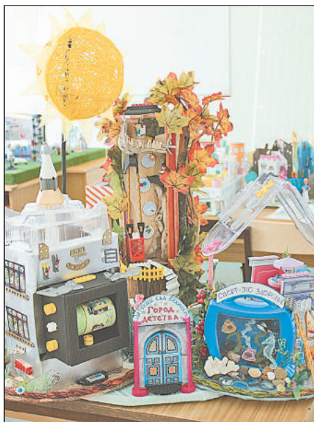
СП «Детский сад «Бабочка» ГБОУ ООШ № 6 г. Новокуйбышевска

Одно из зданий оборудовано как большой зимний сад, где находятся уголок зимнего леса, террариум с пресмыкающимися и пресноводными, декоративные фонтаны, фитобар; оборудованы мини-центры для исследовательской и элементарной трудовой деятельности. На территории детского сада имеется дендропарк, минизоопарк с детёнышами домашних животных, создан интересный ландшафт: цветники, альпийские горки, искусственные ручьи и водопады, песочные дворики,