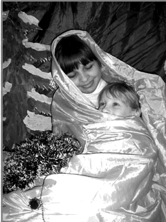
Автор Писаревский Женья

Тем не менее, несмотря на происходящие дискуссии по-