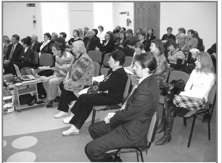
Подведение итогов и награждение победителей областного конкурса профилактических программ образовательных учреждений в Центре социализации молодежи