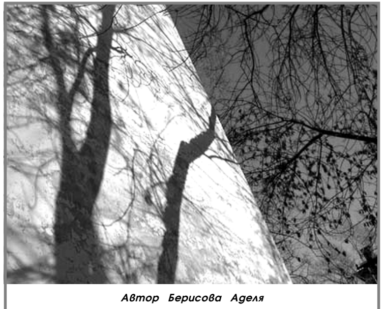
Автор Берисова Агеля