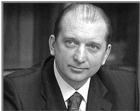
Губернатор Самарской области В.В. Артяков