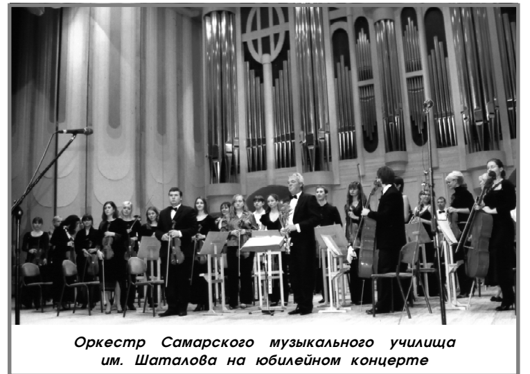
Оркестр Самарского музыкального училища им. Шаталова на юбилейном концерте